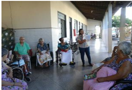
Leitura inclusiva para deficiente visual